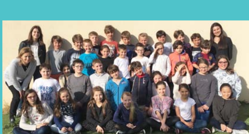
Les élèves de CM de Mallemort

• Revenons sur notre partenariat avec 4 étudiantes de l'IUT d'Aix-en-Provence et l'école primaire Saint Michel du village de Mallemort (13370). Dans le cadre d'une sensibilisation à la solidarité internationale (exposés, documentation, correspondances...) ce beau projet a abouti à succès d'un bol de riz au sein de l'école primaire permettant la remise d'un chèque de 571€ à « SOS pour l'Afrique » qui se réjouit de ce don !