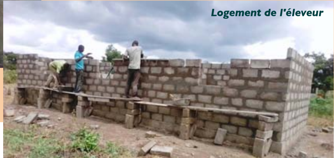
Logement de l'éleveur